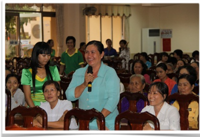
Hội thảo “Phòng ngừa và điều trị cảm cúm” được bác sĩ giới thiệu và nhận được rất nhiều sự quan tâm của các chị em