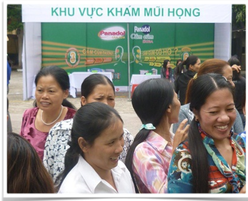
Các chị em tham gia được khám mũi và họng miễn phí Cùng tham gia các trò chơi phân biệt các loại cảm cúm để có cách điều trị cho thích hợp

Đây là một hoạt động thiết thực nhằm giúp người dân giảm bớt những nỗi lo về bệnh cảm cúm theo mùa cũng như nâng cao ý thức về nhận diện, phòng ngừa và điều trị bệnh hiệu quả để bản thân và gia đình an toàn và khỏe mạnh trong mùa cảm cúm. Chia sẻ tại ngày hội “Bác sĩ trị